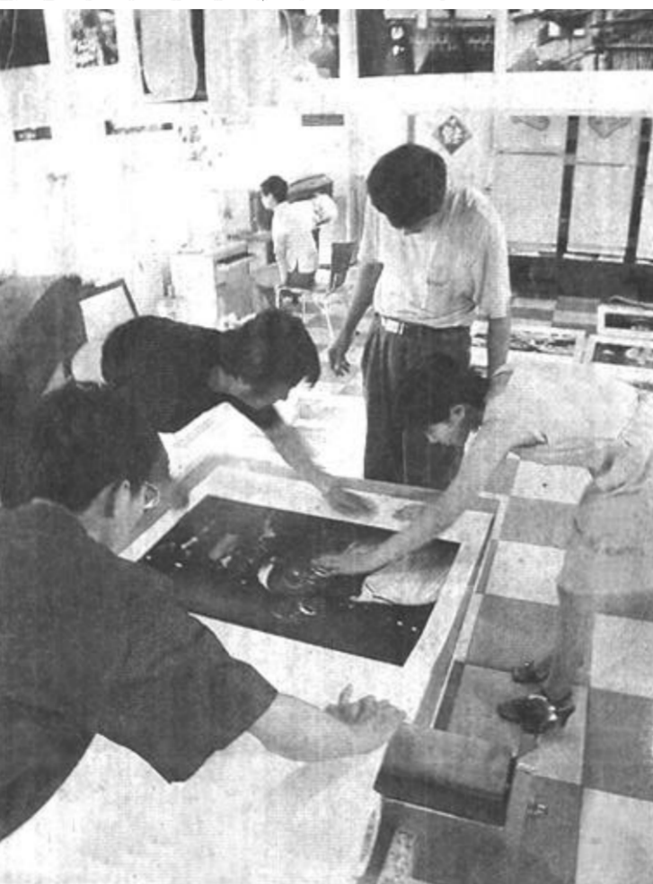
日前，在首届一品国际摄影节上展出的由中外著名摄影家拍摄的近千幅照片，正在紧张地制作中。8月18日，这些作品将在东营与广大观众见面。

学生们通过到图书馆借书、读书，增长了知识，陶冶了情操，减少了社会上不良现象对学生的侵蚀，达到了学校、家长、学生“三满意”。(明义亭 孙胜芳)