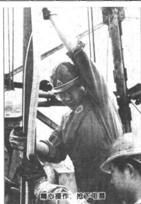
精心操作，抢下电箱