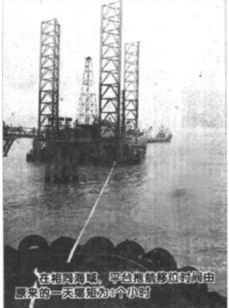
在相异海域，平台拖航移位时间由原来的一天缩短为4个小时

本报讯 近日，市委副书记李永健在市直宣传文化系统会议上就宣传文化系统领导干部如何加强自身修养，提高综合素质，努力实践“三个代表”，提出了四点要求。