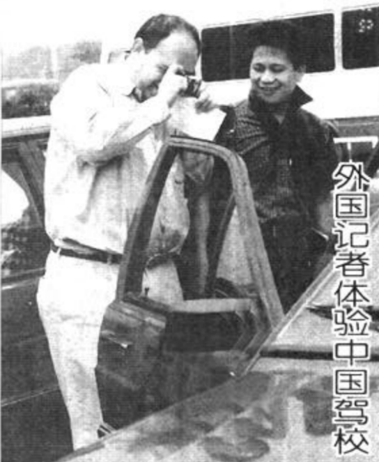
外国记者体验中国驾校

目前,《今日美国》报社记者在北北京龙泉驾校采访了体验了中国特有的学车方式。(新华社稿)