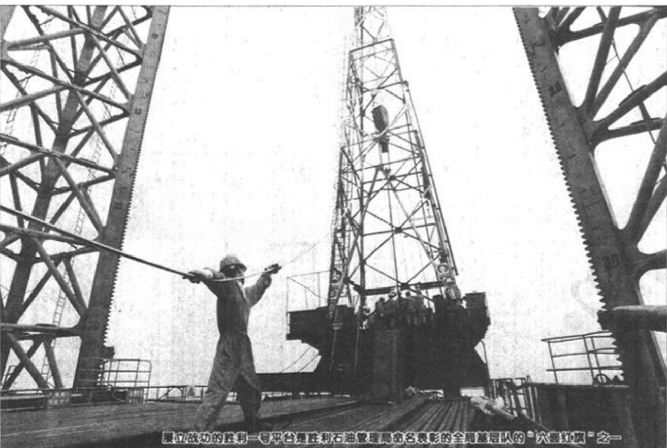
矗立海上的胜利一零平台是胜利石油管理局勇闯海外市场的“旗舰”之一